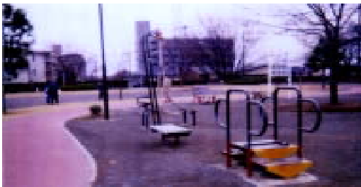
参考 市内岸町健康広場